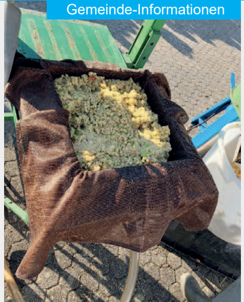
Nun wurde der „Apfelmatsch“ für die Presse vorbereitet.