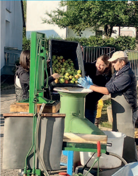
Die Äpfel wurden in den Zerkleinerer“ geschüttet.