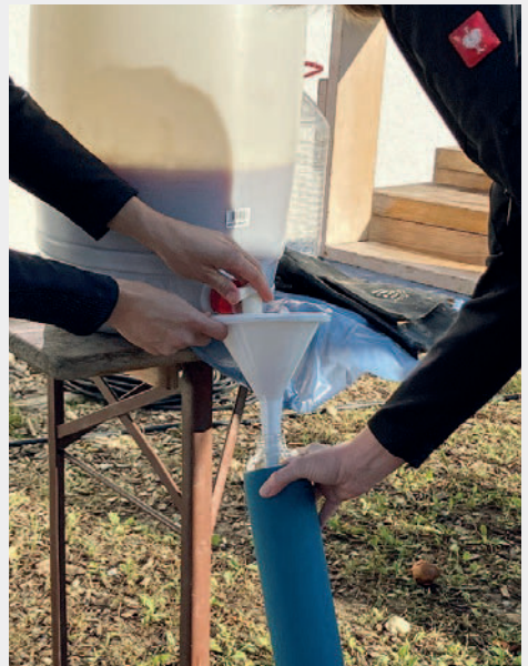
in einen Kanister und von dort in die mitgebrachten Flaschen der Kinder abgefüllt.

Alle ließen sich den leckeren Saft schmecken!