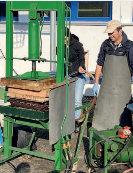
Jetzt wurde gepresst,